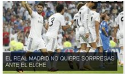
EL REAL MADRID NO QUIERE SORPRESAS ANTE EL ELCHE

Del total de innovaciones registradas, el 51% puede considerarse exitosas y de las 10 innovaciones más exitosas del último año, la práctica totalidad -todas, excepto una- corresponde a marcas de fabricante.